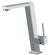
Mischbatterie Master 8493 000